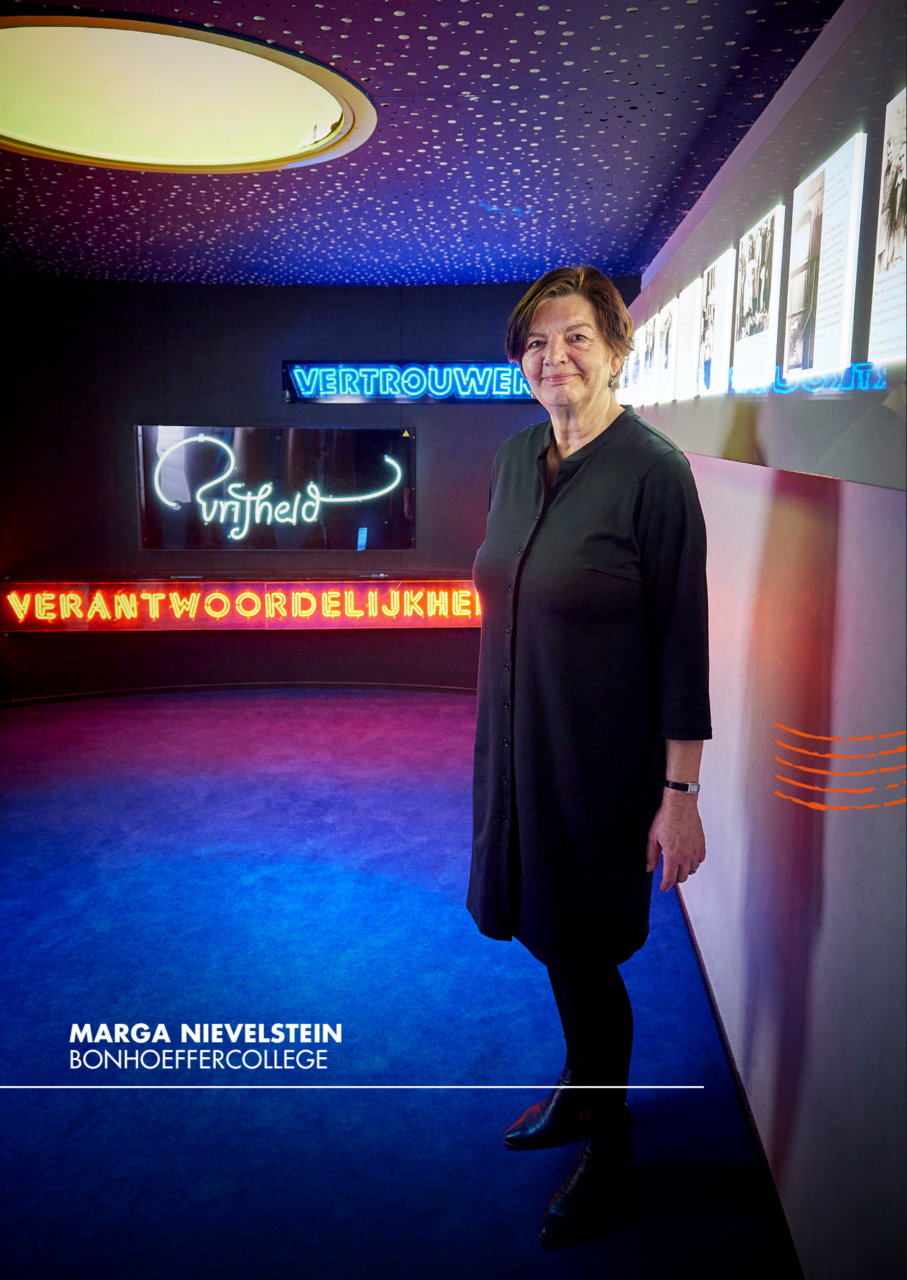
MARGA NIEVELSTEIN BONHOEFFERCOLLEGE