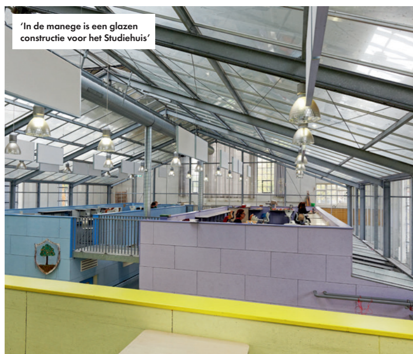
'In de manege is een glazen constructie voor het Studiehuis'