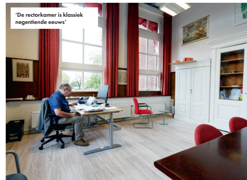
'De rectorkamer is klassiek negentiende eeuws'