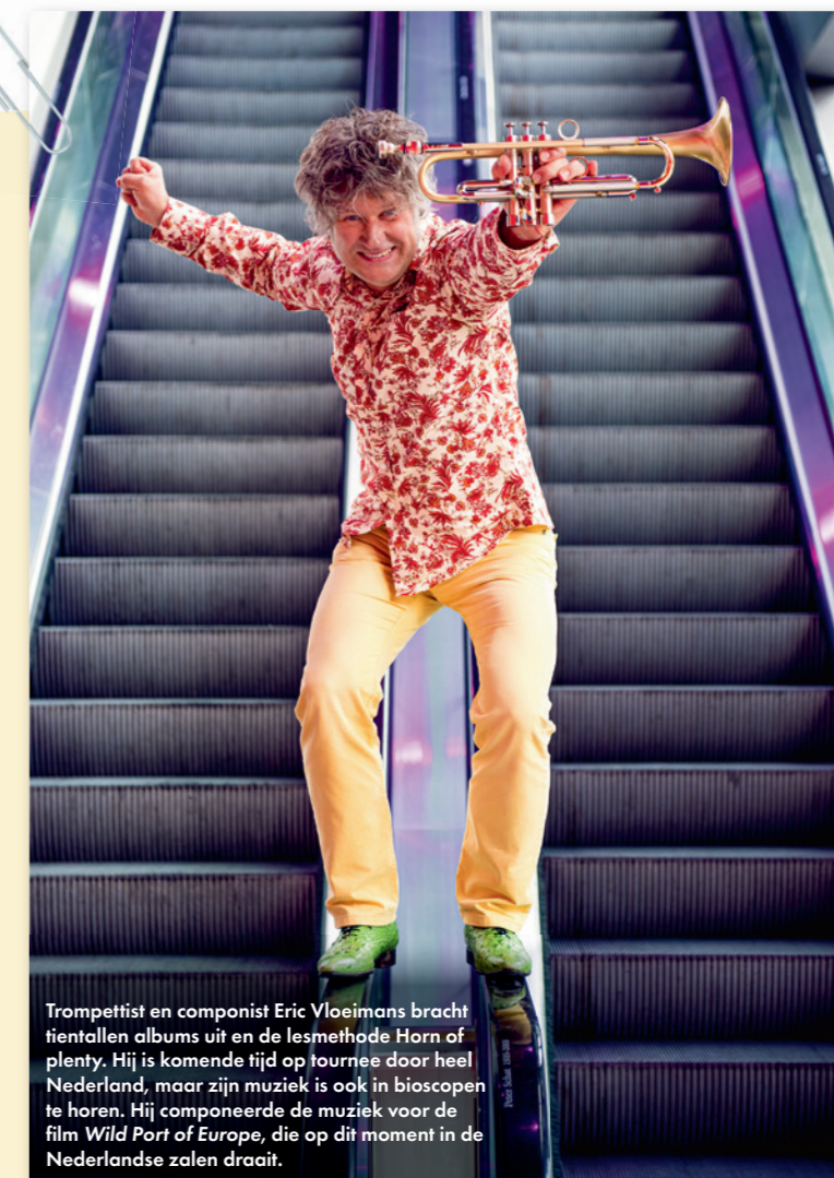
Trompettist en componist Eric Vloeimans bracht tientallen albums uit en de lesmethode Horn of plenty. Hij is komende tijd op tournee door heel Nederland, maar zijn muziek is ook in bioscopen te horen. Hij componeerde de muziek voor de film Wild Port of Europe , die op dit moment in de Nederlandse zalen draait.

"Ik denk dat de mensheid er beter van wordt als we op alle scholen muzieklessen gaan geven. Als je muziek