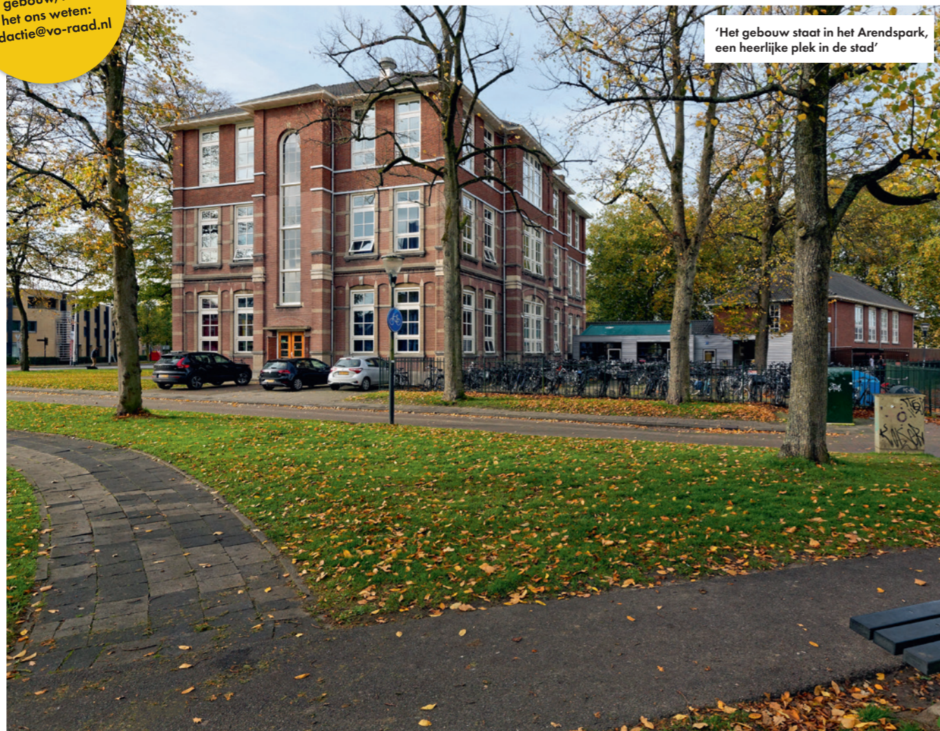
'Het gebouw staat in het Arendspark, een heerlijke plek in de stad'

Heeft u ook een bijzonder gebouw, laat het ons weten: redactie@vo-raad.nl