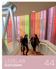
LEERLAB Gorichem 44