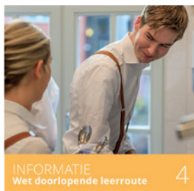
INFORMATIE Wet doorlopende leerroute 4