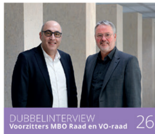
DUBBELINTERVIEW Voorzitters MBO Raad en VO-raad 26