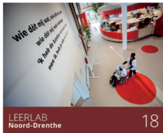
LEERLAB Noord-Drenthe 18