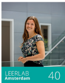
LEERLAB Amsterdam 40