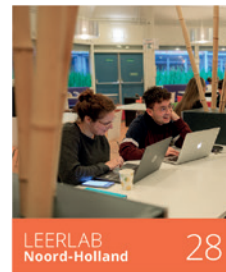
LEERLAB Noord-Holland 28