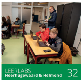
LEERLABS Heerhugowaard & Helmond 32