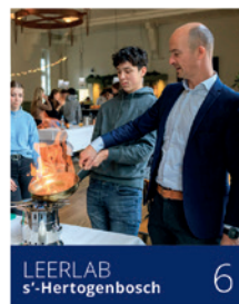
LEERLAB s'-Hertogenbosch 6