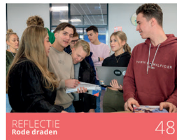
REFLECTIE Rode draden 48