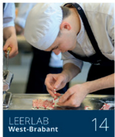
LEERLAB West-Brabant 14