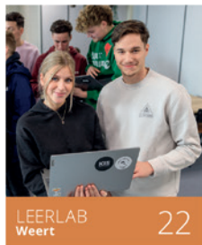
LEERLAB Weert 22