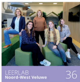
LEERLAB Noord-West Veluwe 36