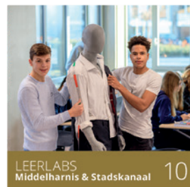
LEERLABS Middelarnis & Stadskanaal 10