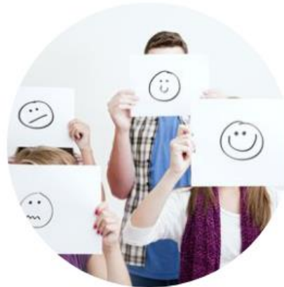
Tools primair onderwijs