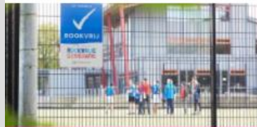
Roken-, alcohol- en drugspreventie