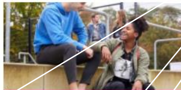
Relaties en seksualiteit