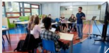
Milieu en natuur