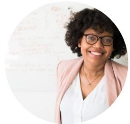
Tools voortgezet onderwijs