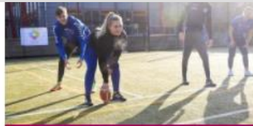
Bewegen en sport