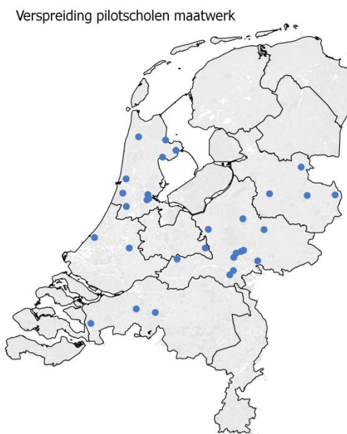
Figuur 2.1 Geografische spreiding van de pilotscholen maatwerk

Een vergelijking naar het soort scholen (onderwijsaanbod) laat zien dat de deelnemers een redelijk goede afspiegeling vormen van de totale groep vo-scholen. Evenals in de totale schoolpopulatie bestaat het grootste deel van de pilotscholen uit brede scholengemeenschappen. Daarbij moet worden aange-tekend dat de meeste brede scholengemeenschappen in de pilot niet met al hun afdelingen aan de pilot meedoen maar dat deze vaak beperkt is tot de afdelingen havo en vwo. Daarnaast nemen veel scholen alleen met de bovenbouw van een of meer afdelingen aan de pilot deel (zie verder paragraaf 2.2).