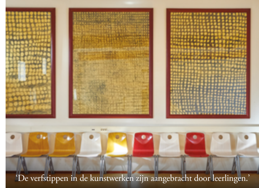
‘De verfstippen in de kunstwerken zijn aangebracht door leerlingen.’